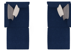
Brazo izquierdo Left arm